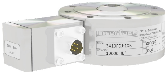
型号 3410FDJ-10K (Shown)